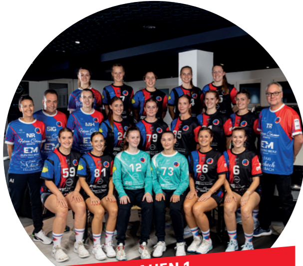
FRAUEN 1 BADEN-WÜRTTEMBERG OBERLIGA

Die erste Frauenmannschaft der Hartwaldpumas ist in der Saison 2022/2023 in die höchste Liga des Bundeslandes aufgestiegen – die Baden-Württemberg Oberliga (BWOL), die gleichzeitig die 4. Liga deutschlandweit bildet. Ein historischer Erfolg für die Spielgemeinschaft!