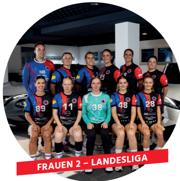
FRAUEN 2 – LANDESLIGA

Das nächste Ziel wird sein sich dort zu etablieren, weiterhin den Unterbau für die Frauen 1 zu bilden und gleichzeitig unseren ambitionierten Jugendspielerinnen eine weitere Entwicklungsmöglichkeit zu bieten.