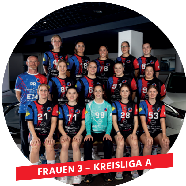
FRAUEN 3 – KREISLIGA A

Ziel ist es das obere Drittel anzugreifen, jungen Spielerinnen Spielzeiten im Aktiven-Bereich zu ermöglichen und mittelfristig in die Bezirksklasse aufzusteigen.